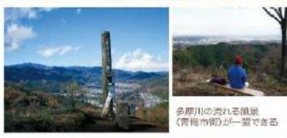
多摩川の光る風景 《青梅市街》が一望できる

赤ぼっこは1923年に発生した関東大震災で巻土が崩落し赤い土が露出したことによる山頂からの眺望は、関東平野や奥多摩の山が見渡せます。