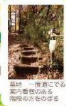
高地一帯道に 案内看板のある 階段の方をのぼる