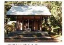
天祖神社をみる 本殿の右奥をみる

高さ6m幅15mほどの大岩。 ごんにやく玉に取っている。 大崗日の渡江ごんにやくのように 来るがくならず書も通す、などの説話も。