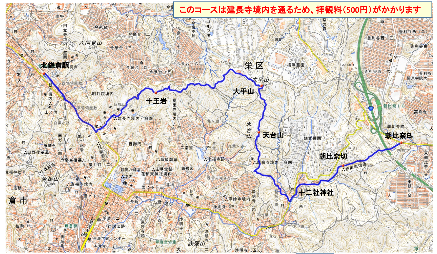
北鎌倉駅 ⇒ 朝比奈BS

天園ハイキングコースとも呼ばれる鎌倉アルプスは鎌倉市街の北東、横浜市との境にある山並み。コースのところどころからは海が眺められ、季節を通じてハイカーが訪れる人気のコース。 大平山(おおひらやま)は、鎌倉市の最高峰。標高159.2メートル。この大平山一帯が天園と呼ばれている所です。ちょうど、横浜市との境で、栄区の最高峰地点となっています。「天園」と言う名前はかつて東郷平八郎が「天国の園に遊ぶようだ」と形容したこと由来していると言われています。 三方を山に囲まれた鎌倉は、鎌倉幕府にとっては守りを固めやすい有効な地形です。しかし、多くの人が暮らす都市には物流のために各地の要所とつながる必要があります。そのための陸路が切り開かれました。山を削り、整備されたのが、鎌倉七口と呼ばれる切通です。現在の東京方面と結ぶ「亀ヶ谷坂」「化粧坂」「巨福路坂」藤沢・京都方面と結ぶ「大仏切通」「極楽寺切通」、三浦半島と結ぶ「名越切通」横浜方面への「朝比奈切通」。そのなかでも最も険しかったとされているのが、朝比奈切通です。深く削り取られた岩肌とそれを削ったノミの跡、生い茂ったシダ、峠の頂上には当時の茶屋の跡があります。