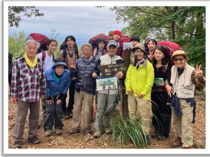
明るく開けた岩茸石山の山頂