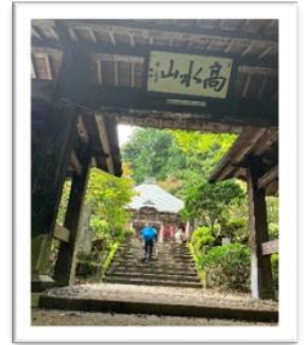
重要文化財の古利