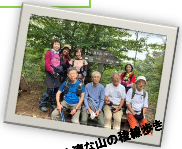
快適な山の稜線歩き