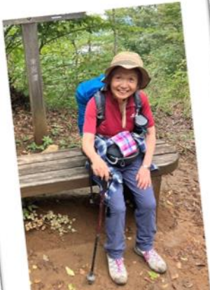
山道へ最後のひと登り