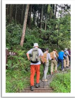
民家の裏から山道に入る