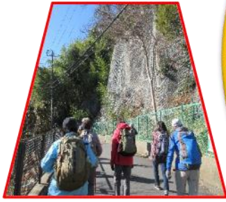
住宅街をウロウロ歩く