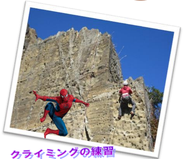
クライミングの練習