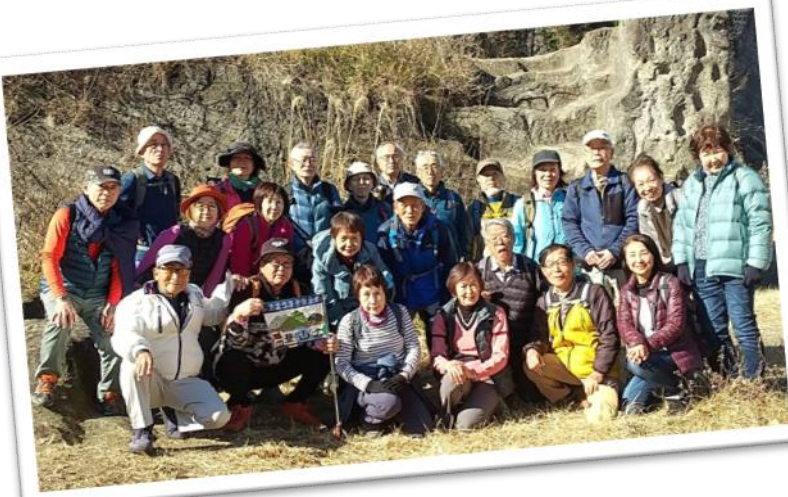
岩場の多い尾根道をたどった変化に富んだ道