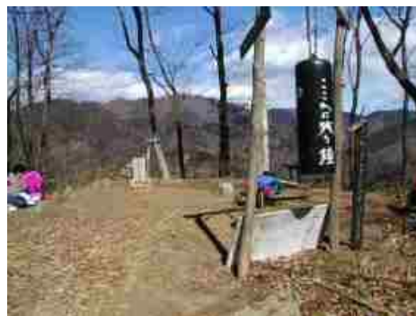
左から岩戸山・小湊山・鷹取山

岩戸山は南側が開け、ピラミダルな大室山を始めとして、ここからの展望も素晴らしい。道志の山々の向こうにチラッと富士山も見える。鷹取山の山頂南に「ここに残る鐘」、北側に「鷹取山烽火台跡」の標柱、中央に「鷹取山神社」の石碑がある