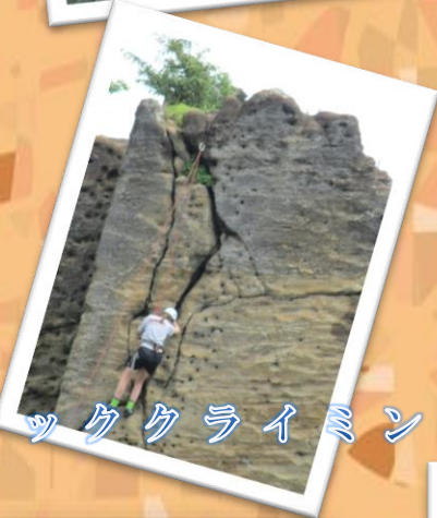
ロッククライミング