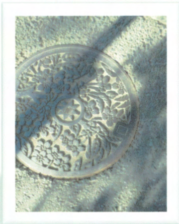
マンホールの蓋です