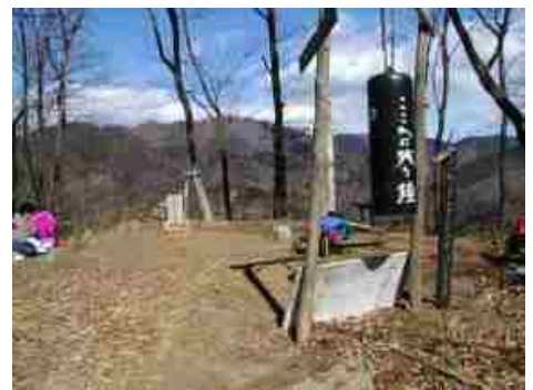
左から岩戸山・小湊山・鷹取山

岩戸山は南側が開け、ピラミダルな大室山を始めとして、ここからの展望も素晴らしい。道志の山々の向こうにチラッと富士山も見える。鷹取山の山頂南に「ここに残る鐘」、北側に「鷹取山烽火台跡」の標柱、中央に「鷹取山神社」の石碑がある