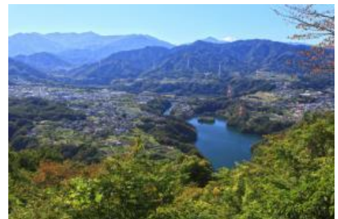
見晴台から津久井湖